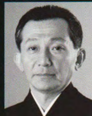
観世 清和 Kanze Kiyokazu