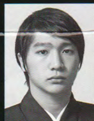
観世 三郎太 Kanze Saburota