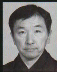
山階 彌右衛門 Yamashina Yacmon